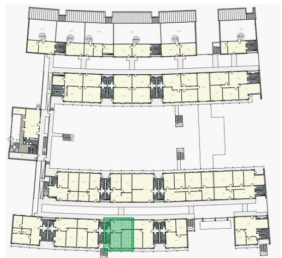
Büro A30 Lage im HIMO OG