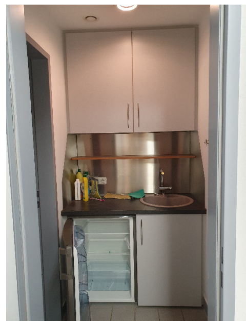
Büro A30 – Teeküche