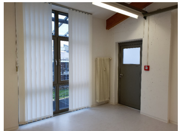
Büro A30 – Büro Südseite