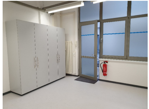
Büro A30 – Büro Eingangsbereich