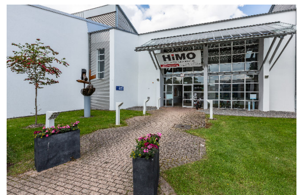
Herzlich Willkommen im HIMO!