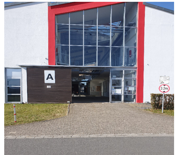
Zuwegung Passage A