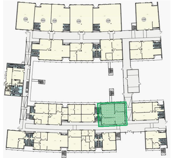
Halle A4 Lage im HIMO EG

Nebenkosten: 2,00 EUR pro Monat und m 2 (entsprechend der Angabe bei der Miete) Kautions: 3 x Bruttokaltmiete Objektzustand: Gepflegt Baujahr Gebäude: 1995 Etage(n): 2 Lage im Gebäude: Erdgeschoss Zugang/Zufahrt über Passage, 2 Doppelflügeltüren Anzahl der Parkflächen: 200 Preis pro Parkfläche: ab 10,50 EUR DV-Verkabelung vorhanden: Ja Starkstromanschluss: Ja Bodenbelag: Industriefußboden/Teppichboden Fußweg zu Öffentlichen Verkehrsmitteln: 1 Min. Fahrzeit zum nächsten Hauptbahnhof: 45 Min. Fahrzeit zur nächsten BAB: 20 Min.