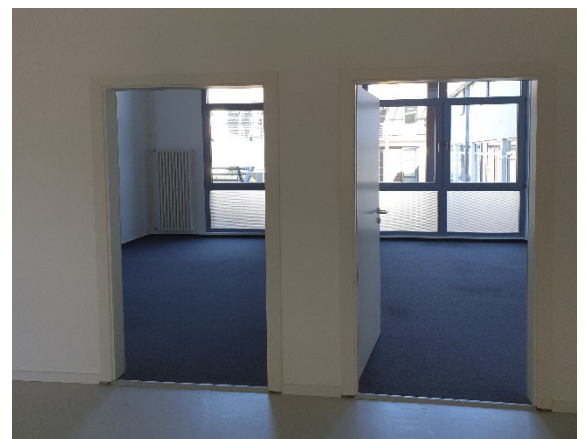
Halle A4 – Blickrichtung Büros