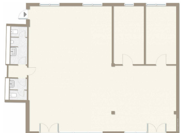
Halle A4 – Grundriss unmöbliert