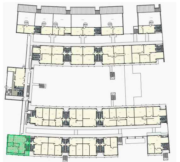
Büro A33 Lage im HIMO OG