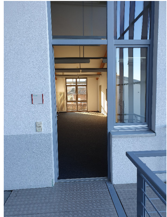
Büro A33 – Büro Eingangsbereich