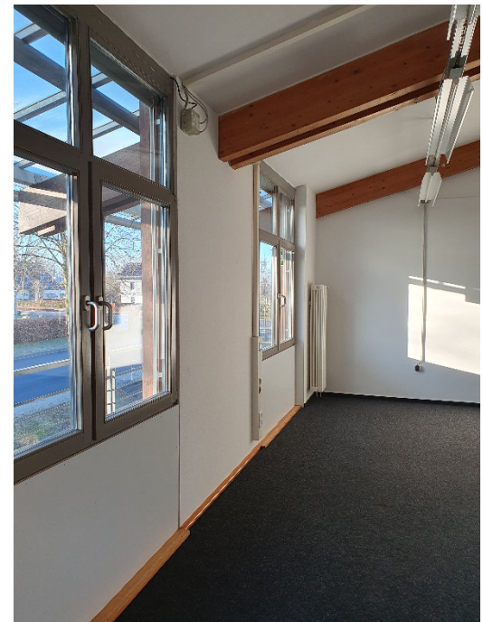
Büro A33 – Büro Südseite