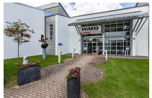
Herzlich Willkommen im HIMO!