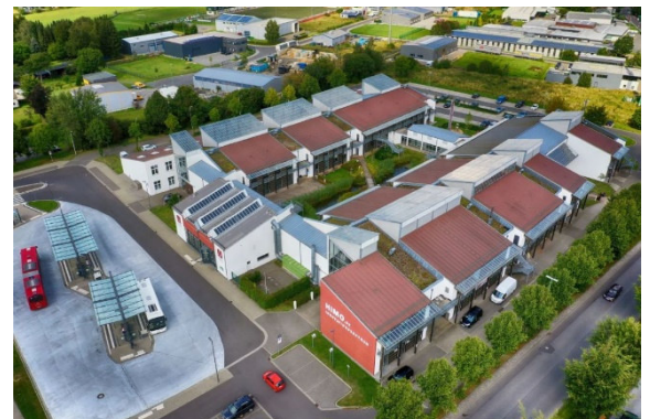
Luftaufnahme HIMO mit Bushof