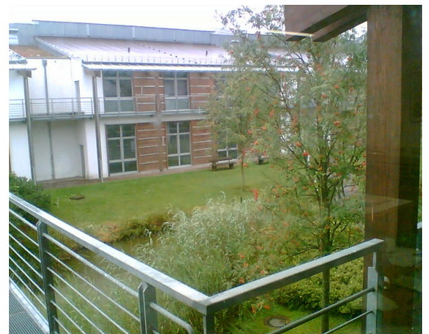
Büro B23.3 – Ausblick Innenhof