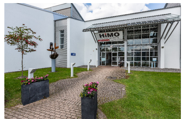
Herzlich Willkommen im HIMO!