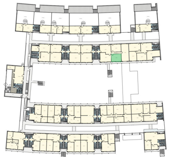
Büro B23.3 Lage im HIMO OG